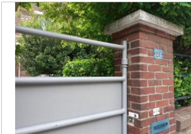
portail d'entrée donnant sur la rue