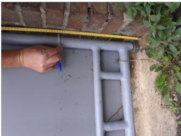
Laisse de végétation sur le portail à 37 cm à partir du sol