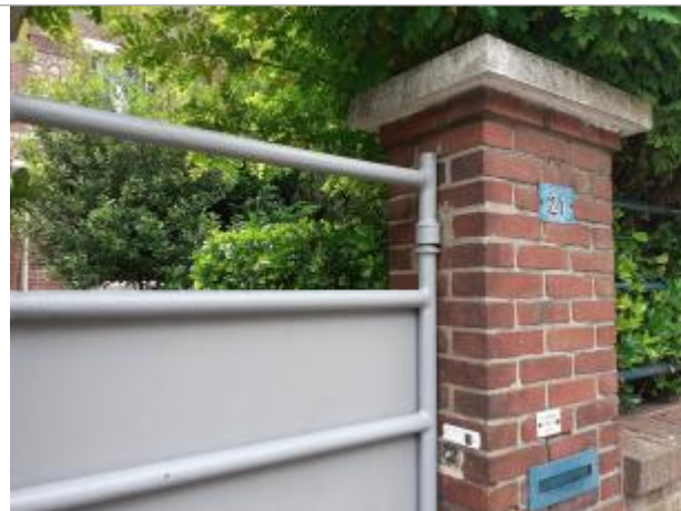
portail d'entrée donnant sur la rue

Coordonnées RGF93 (ETRS89) : X: 1.094073 / Y: 49.4581328