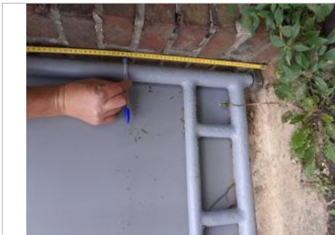
Laisse de végétation sur le portail à 37 cm à partir du sol