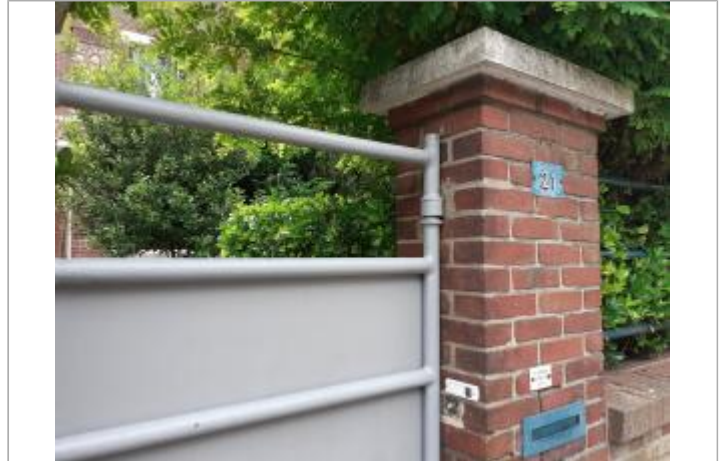
portail d'entrée donnant sur la rue