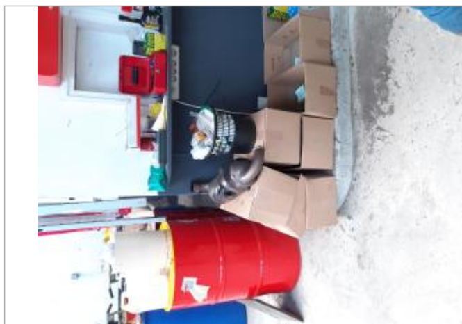
inondation jusqu'au haut de la margelle