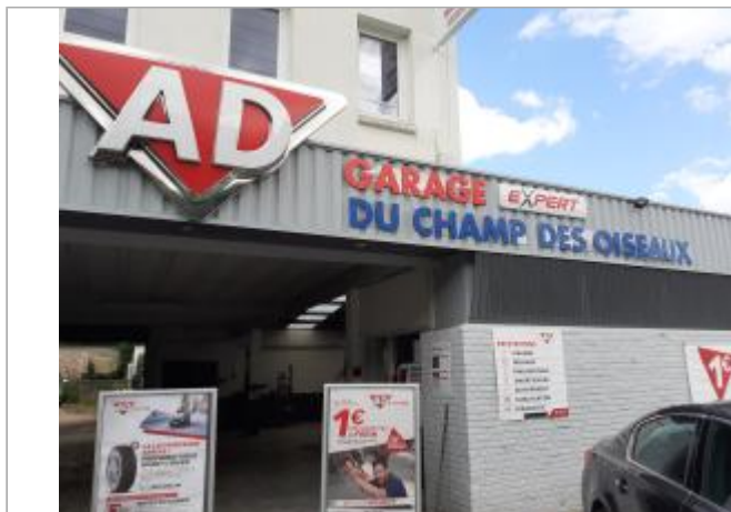
Garage du champ des Oiseaux

Coordonnées RGF93 (ETRS89) : X: 1.0946127 / Y: 49.4577612