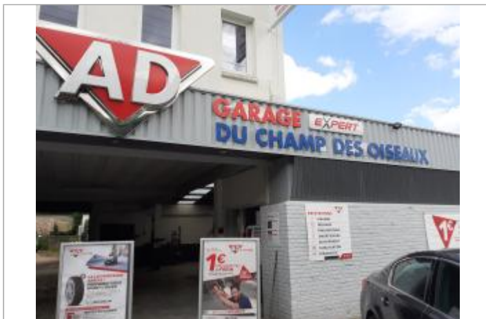
Garage du champ des Oiseaux