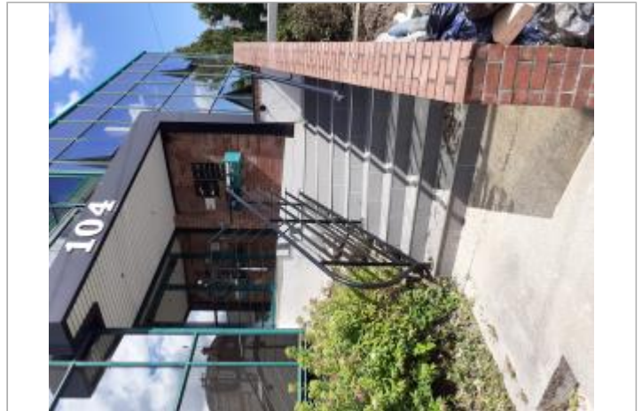
Escalier d'accès à la partie supérieure du 104 chemin de Clères