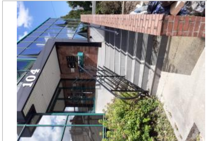
Escalier d'accès à la partie supérieure du 104 chemin de Clères

Coordonnées RGF93 (ETRS89) : X: 1.0948877 / Y: 49.4574162