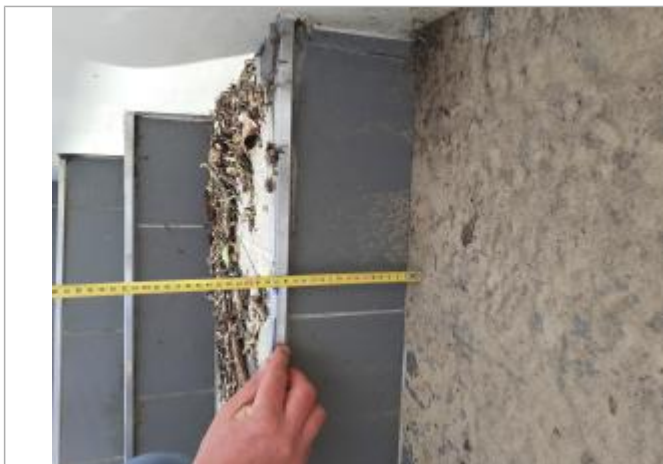
dépôt de végétation sur la première marche (supérieure à 17 cm)