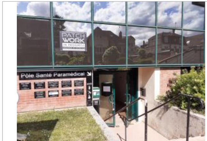
hall d'accès du cabinet médical

Coordonnées RGF93 (ETRS89) : X: 1.0948837 / Y: 49.4574562