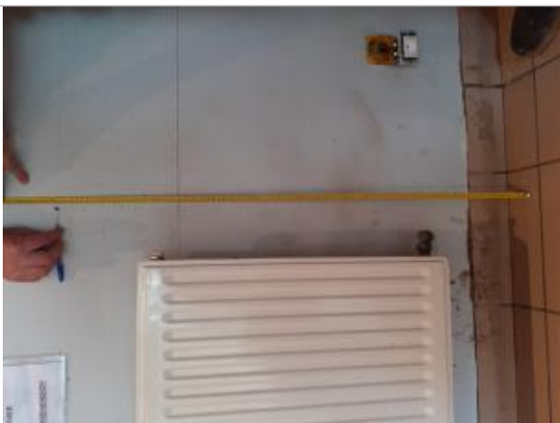
Hauteur d'eau à 99 cm à partir du sol dans le hall d'entrée du cabinet médical