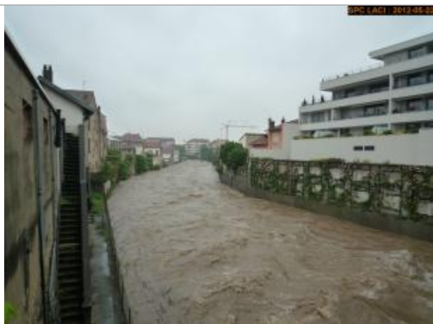
Vue de la photo en 2012

Altitude calculée de l'eau (en m) : 253.662