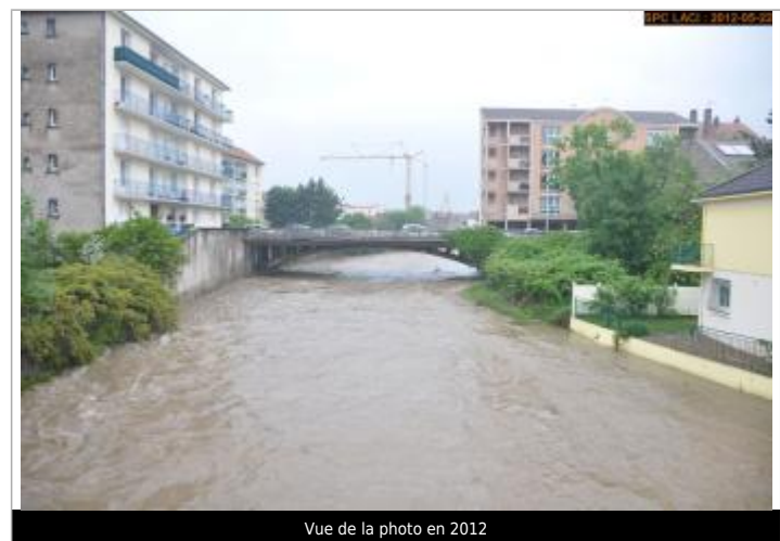
Vue de la photo en 2012

GÉNÉRAL Code : WEB_R_202401024226 Date de mise à jour : 03/01/2024 Auteur : SPC LACI