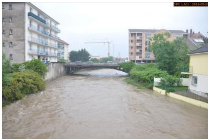
Vue de la photo en 2012

Altitude calculée de l'eau (en m) : 252.394 m