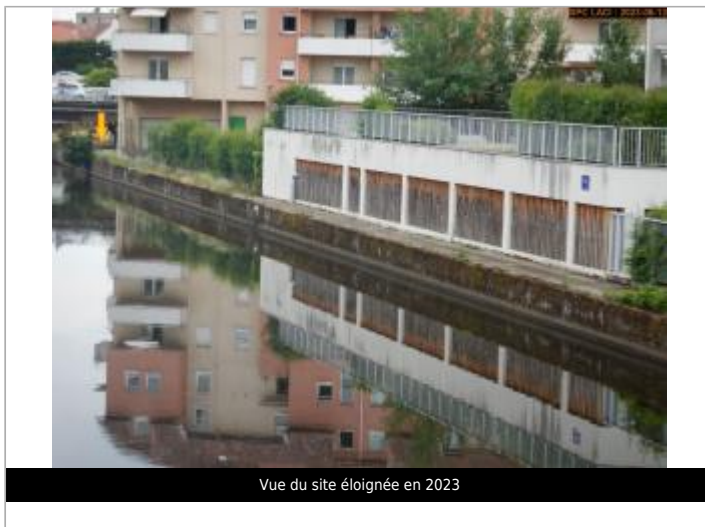
Vue du site éloignée en 2023