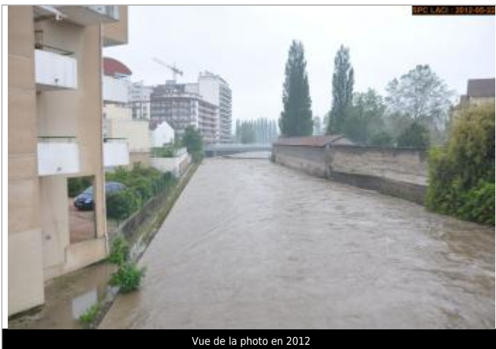
Vue de la photo en 2012

Altitude calculée de l'eau (en m) : 252.341 m