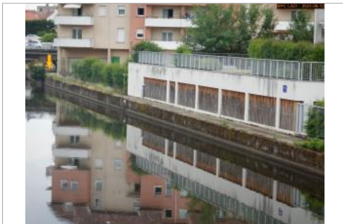
Vue du site éloignée en 2023