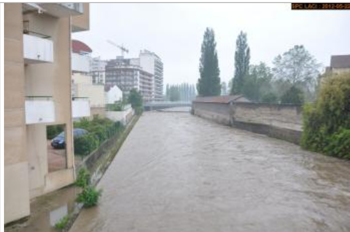
Vue de la photo en 2012

Altitude calculée de l'eau (en m) : 252.341