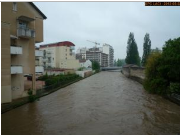
Vue de la photo en 2012

Altitude calculée de l'eau (en m) : 251.995 m