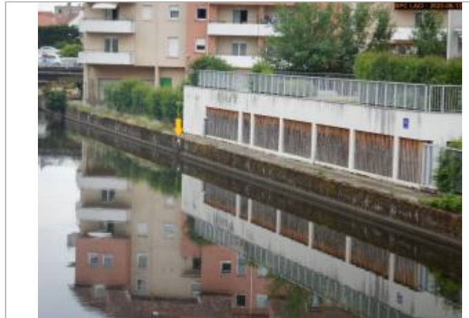
Vue du site éloignée en 2023

Coordonnées WGS84 : X: 3.41765190 / Y: 46.13326470