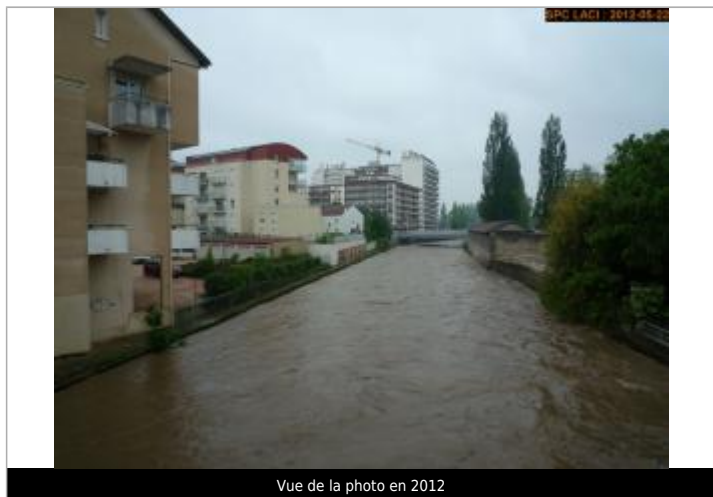
Vue de la photo en 2012

Altitude calculée de l'eau (en m) : 251.995