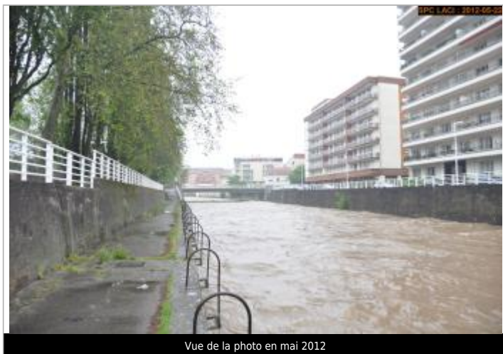
Vue de la photo en mai 2012

Altitude calculée de l'eau (en m) : 251.129