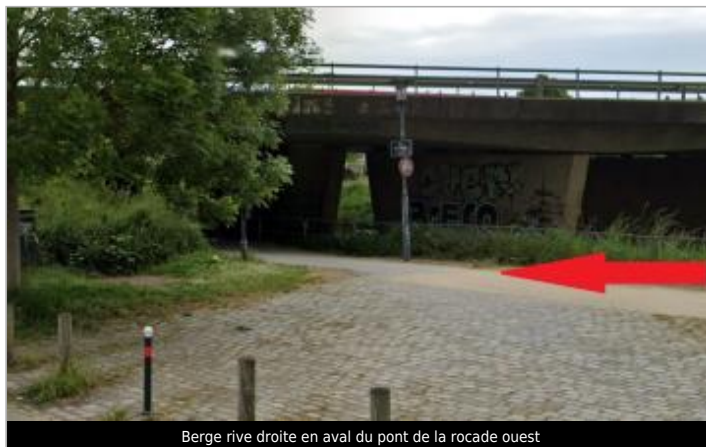
Berge rive droite en aval du pont de la rocade ouest