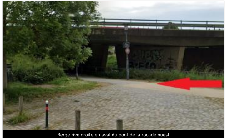
Berge rive droite en aval du pont de la rocade ouest

Coordonnées WGS84 : X: -1.71733922 / Y: 48.10549450