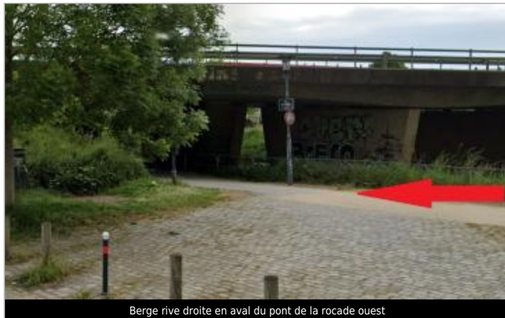
Berge rive droite en aval du pont de la rocade ouest

Coordonnées WGS84 : X: -1.71733922 / Y: 48.10549450