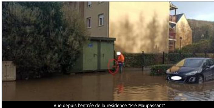
Vue depuis l'entrée de la résidence "Pré Maupassant"