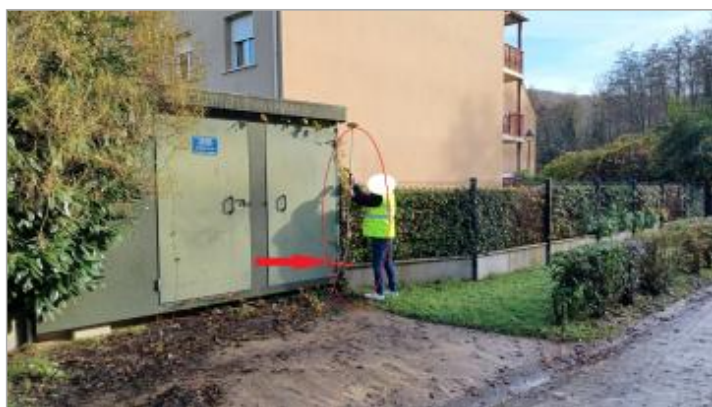
Vue depuis l'entrée de la résidence "Pré Maupassant"