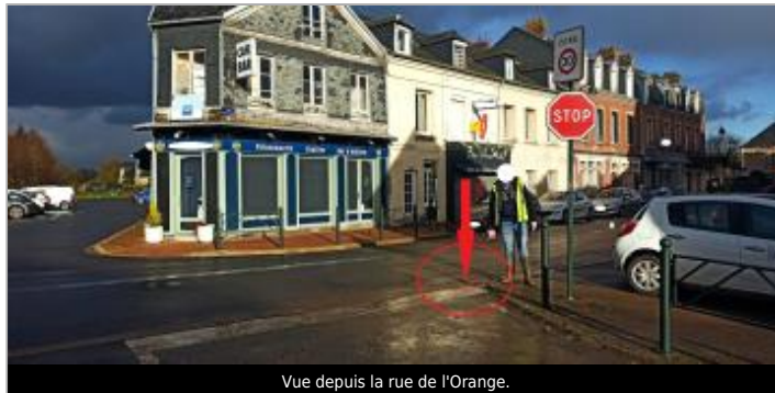
Vue depuis la rue de l'Orange.