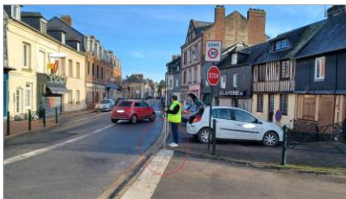
Hauteur estimé à 5 cm/sol