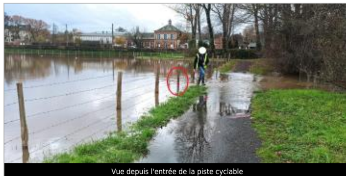
Vue depuis l'entrée de la piste cyclable

GÉOLOCALISATION Coordonnées WGS84 : X: 0.18433805 / Y: 49.28477210 Coordonnées RGF93 (Lambert 93) X: 495145.82 / Y: 6913113.29 Coordonnées RGF93 (ETRS89) : X: 0.1843381 / Y: 49.2847721 Code Hydro: I0--0200 Rive de référence: Gauche