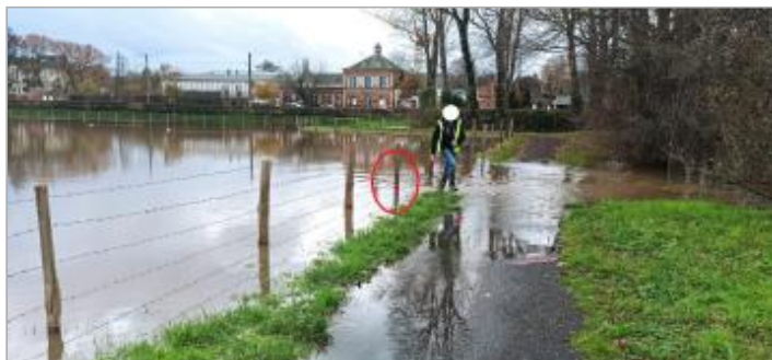
Vue depuis l'entrée de la piste cyclable