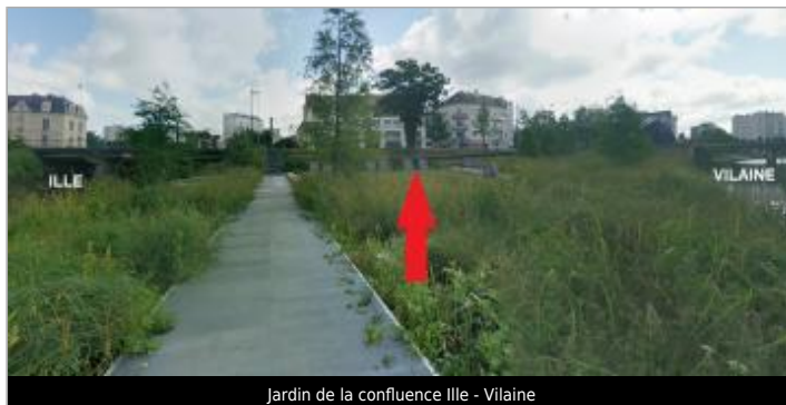
Jardin de la confluence Ille - Vilaine