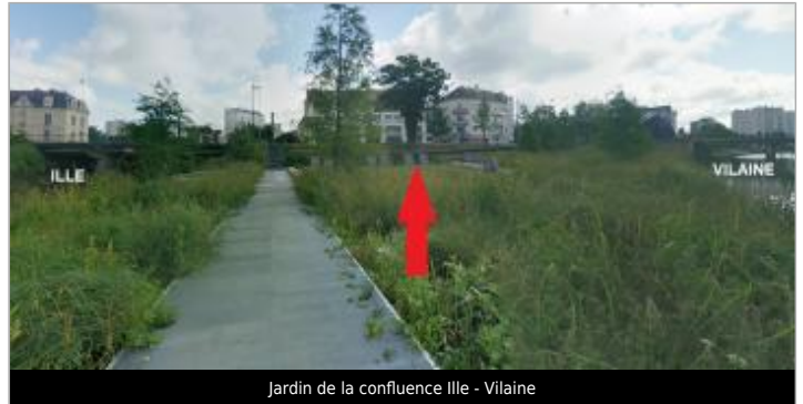
Jardin de la confluence Ille - Vilaine

Coordonnées WGS84 : X: -1.69626148 / Y: 48.10836870