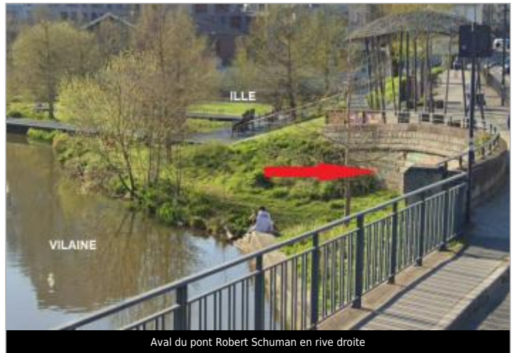
Aval du pont Robert Schuman en rive droite

Coordonnées WGS84 : X: -1.69580219 / Y: 48.10820050