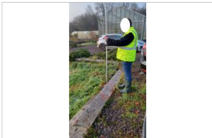
Laisse de crue à 5 cm au dessus de la margelle.

Altitude calculée de l'eau (en m) : 11.53 m