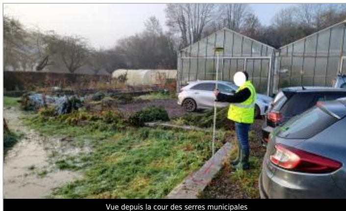
Vue depuis la cour des serres municipales