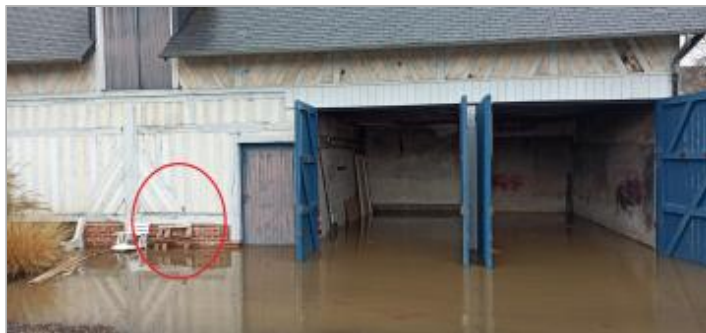
Vue depuis la cour des serres municipales