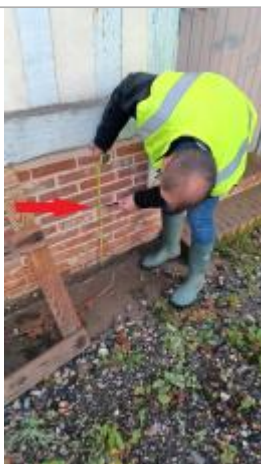
Laisse de crue à 56 cm/sol

Altitude calculée de l'eau (en m) : 10.9