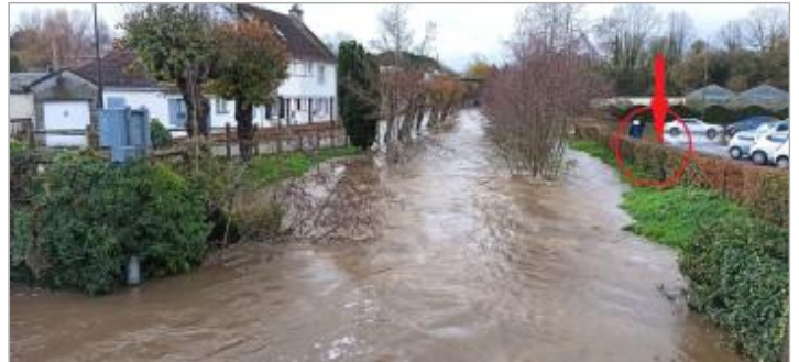
Vue depuis le pont de la rue Saint Mélaïne

Coordonnées WGS84 : X: 0.18971433 / Y: 49.29076320