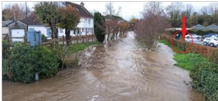
Vue depuis le pont de la rue Saint Mélaire