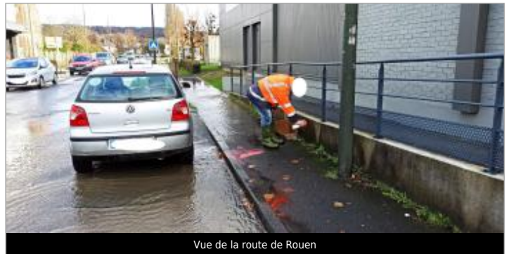
Vue de la route de Rouen

Coordonnées WGS84 : X: 0.19250898 / Y: 49.29149040