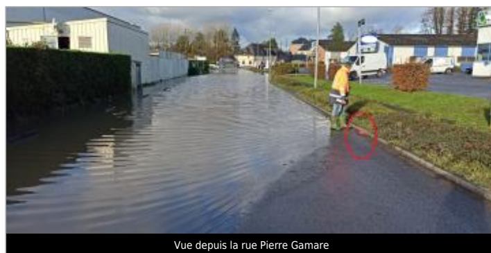
Vue depuis la rue Pierre Gamare

GÉOLOCALISATION Coordonnées WGS84 : X: 0.19494866 / Y: 49.29184900 Coordonnées RGF93 (Lambert 93) X: 495945.43 / Y: 6913872.56 Coordonnées RGF93 (ETRS89) : X: 0.1949487 / Y: 49.291849 Code Hydro: I03-0400 Rive de référence: Gauche