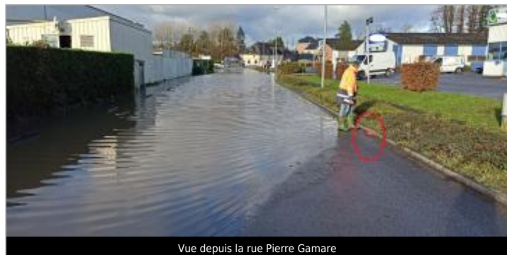
Vue depuis la rue Pierre Gamare

GÉOLOCALISATION Coordonnées WGS84 : X: 0.19494866 / Y: 49.29184900 Coordonnées RGF93 (Lambert 93) X: 495945.43 / Y: 6913872.56 Coordonnées RGF93 (ETRS89) : X: 0.1949487 / Y: 49.291849 Code Hydro: I03-0400 Rive de référence: Gauche