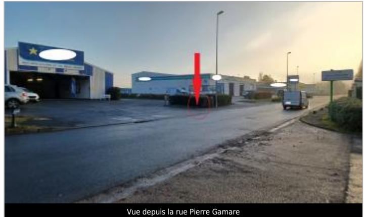
Vue depuis la rue Pierre Gamare

Coordonnées WGS84 : X: 0.19437375 / Y: 49.29216910