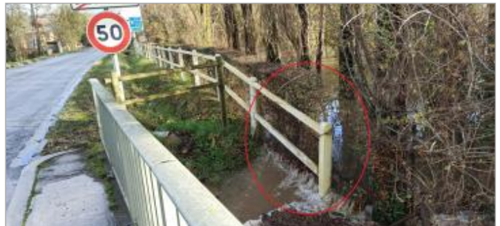
Vue depuis la route de Rouen

Coordonnées WGS84 : X: 0.19416851 / Y: 49.29293060