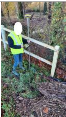
Laisse de crue à 41 cm/sol

Altitude calculée de l'eau (en m) : 13.3 m