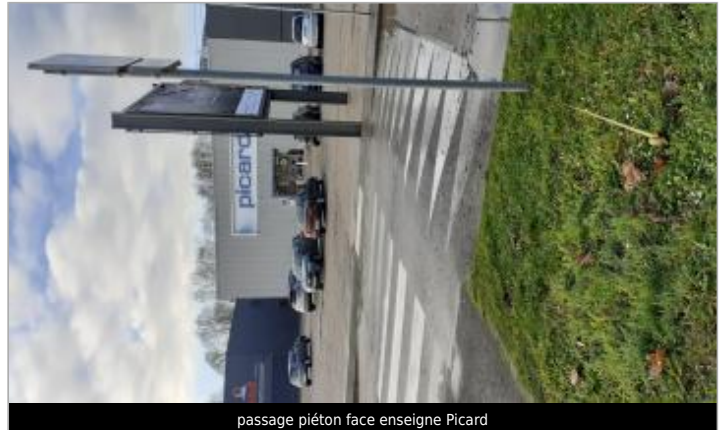
passage piéton face enseigne Picard

Coordonnées WGS84 : X: 0.18884607 / Y: 49.52680390