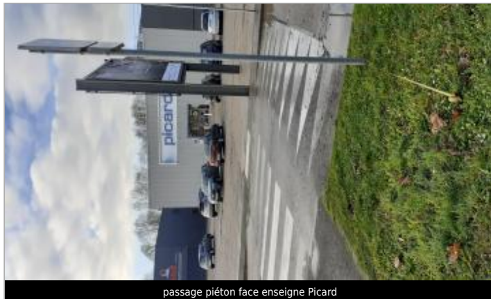
passage piéton face enseigne Picard