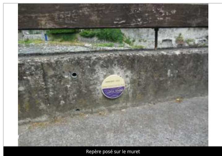
Repère posé sur le muret