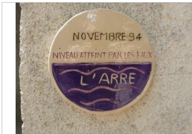
Repère posé sur le bâtiment des vestiaires