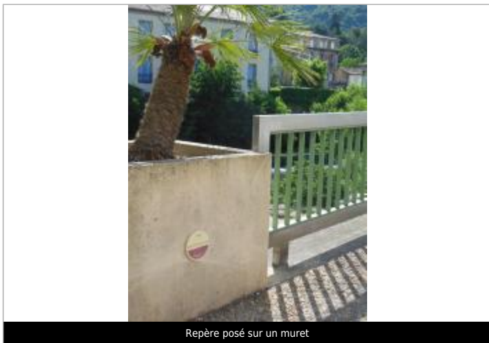
Repère posé sur un muret

Texte : 1963 Maximum de l'inondation : Oui Visibilité : Oui État du repère : Bon Pérennité : Longue