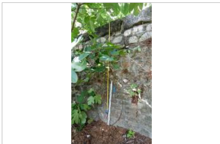
vue de la laisse

Maximum de l'inondation : Oui Pérennité : Aucune