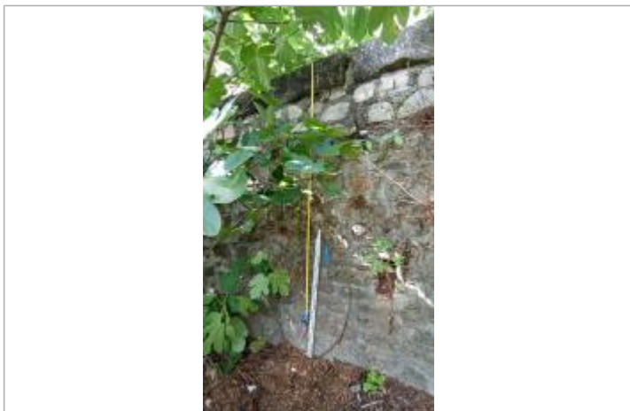
vue de la laisse

Maximum de l'inondation : Oui Pérennité : Aucune