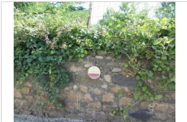
Repère posé sur le muret