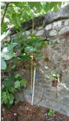
vue de la laisse