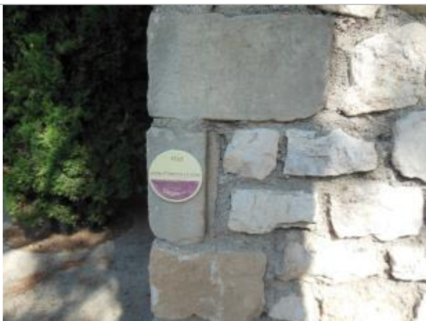
Repère posé à l'entrée du cimetière