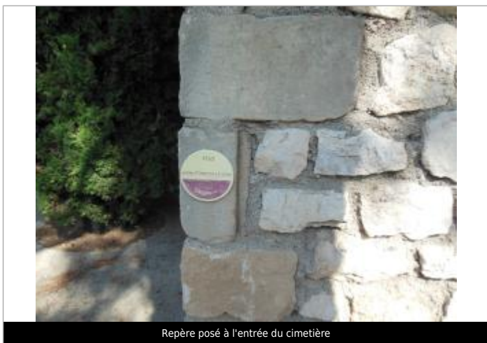
Repère posé à l'entrée du cimetière

Texte : 1963 Maximum de l'inondation : Oui Visibilité : Oui État du repère : Bon Pérennité : Longue