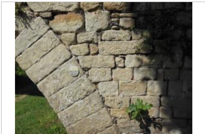
Repère posé sur une pile du pont