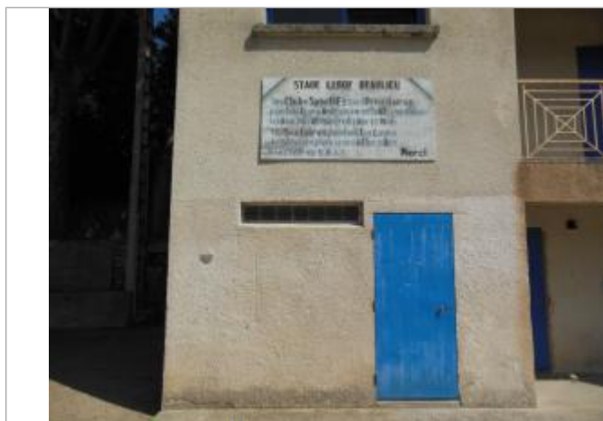
Repère posé sur un bâtiment du stade