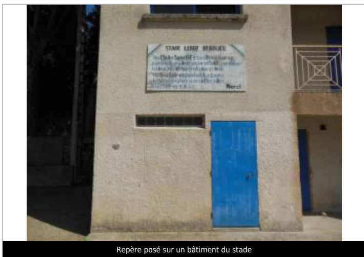
Repère posé sur un bâtiment du stade

Texte : 1963 Maximum de l'inondation : Oui Visibilité : Oui État du repère : Bon Pérennité : Longue