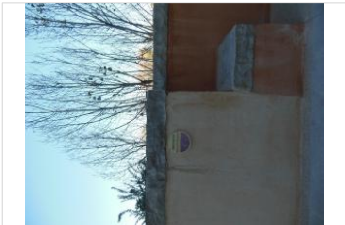
Repère posé sur le muret

Texte : 1997 Maximum de l'inondation : Oui Visibilité : Oui État du repère : Bon Pérennité : Longue