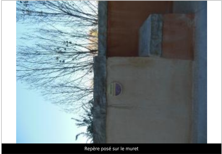
Repère posé sur le muret