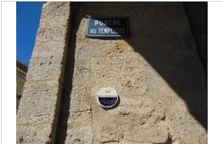
Repère posé sur le porche des templiers