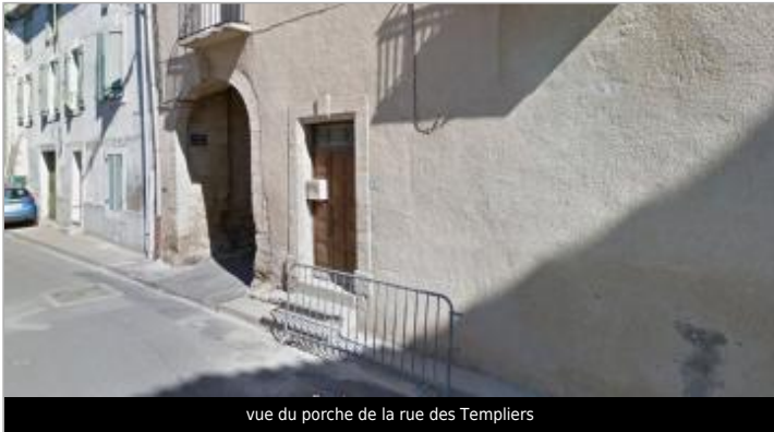
vue du porche de la rue des Templiers