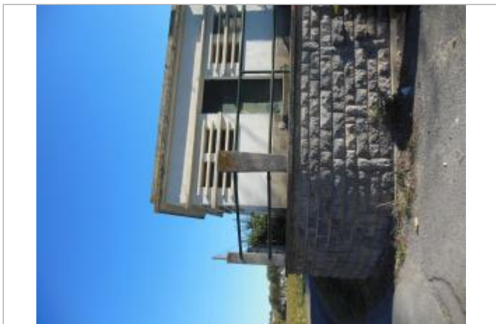
Repère posé sur l'ancien puits