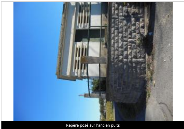
Repère posé sur l'ancien puits

GÉNÉRAL Code : WEB_R_202312204143 Date de mise à jour : 07/03/2024 Auteur : EPTB Fleuve Hérault