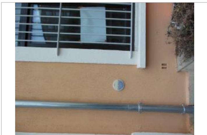
Repère posé sur le bâtiment de la mairie

Texte : 1964 Maximum de l'inondation : Oui Visibilité : Oui État du repère : Bon Pérennité : Longue