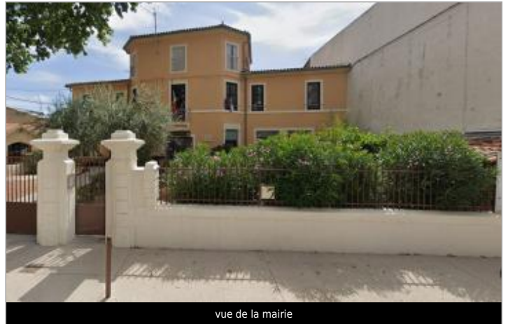
vue de la mairie