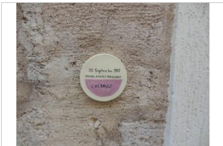
Repère posé sur le bâtiment

Texte : 1907 Maximum de l'inondation : Oui Visibilité : Oui État du repère : Bon Pérennité : Longue