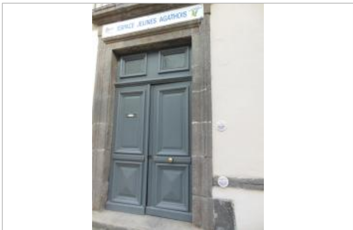
Repère posé à l'entrée du bâtiment

GÉNÉRAL Code : WEB_R_202312201632 Date de mise à jour : Auteur : EPTB Fleuve Hérault 05/03/2024