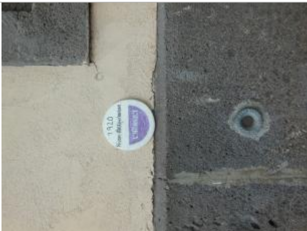
Repère posé sur le bâtiment des services techniques