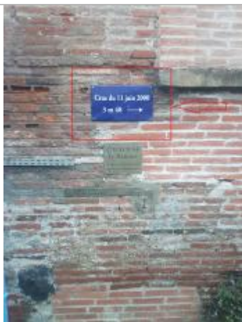
Vue du repère, 2023, auteur: Pierre I.

Différence entre le niveau d'eau et la référence (en m) : 3.480 m