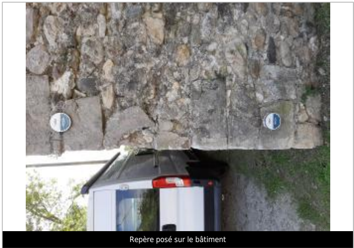
Repère posé sur le bâtiment