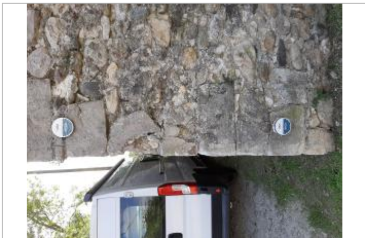
repères sur bâtiment