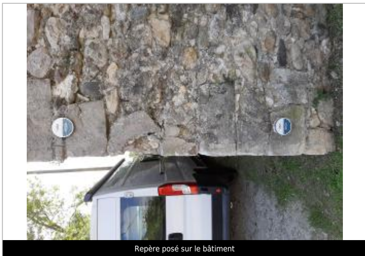
Repère posé sur le bâtiment

Texte : 1958 Maximum de l'inondation : Oui Visibilité : Oui État du repère : Bon Pérennité : Longue